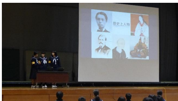
プレゼン GP 発表会の様子

結果は、最優秀賞は3組「大野の水の大切さ」、優秀賞が2組「つくも橋と私たち」、敢闘賞が6組「イトヨと水の関係」でした。仲間の素晴らしいパフォーマンスはこれからの良いモデルとなったと思われました。