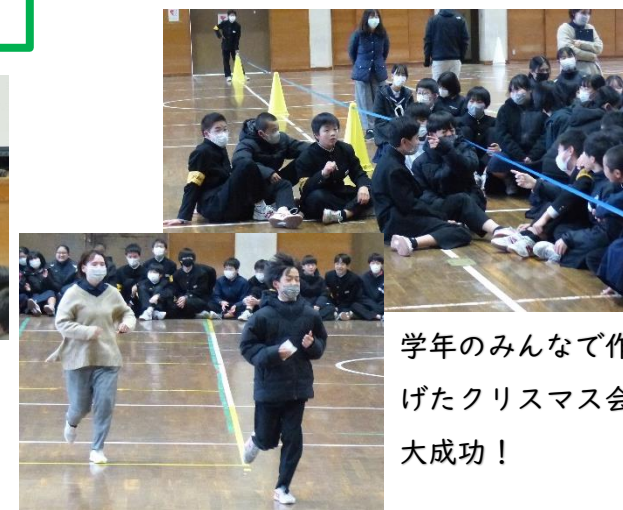
学年のみんなで作り上げたクリスマス会、大成功！

企画・運営を担当した実行委員の皆さんの仕切りの上手さはもちろんのこと、参加した学年の皆さんの協調性の成長もとても感じる事ができました。