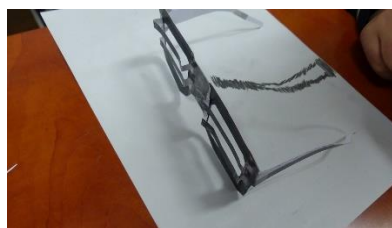
世界に一つだけのオリジナルめがね