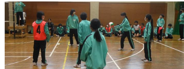
チームワークで戦いました。

優勝は6組、準優勝は4組、3位は3組でした。また、チームワーク賞に1、4、7、8組が、特別賞に2、5組が選ばれました。