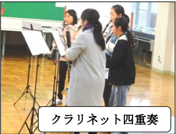
クラリネット四重奏