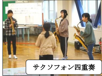
サクソフォン四重奏