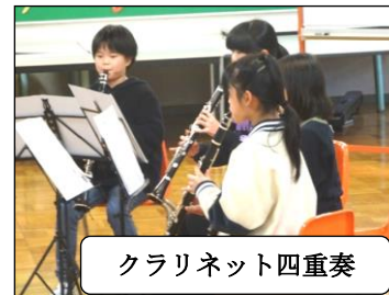
クラリネット四重奏