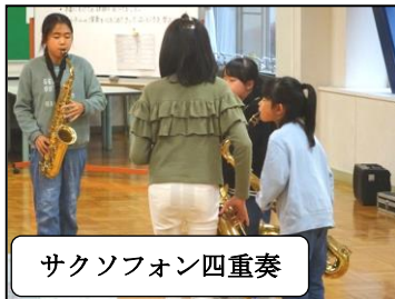
サクソフォン四重奏