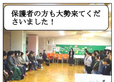
保護者の方も大勢来てくださいました！

1月12日(日)に今立芸術館で開催される第40回丹南地区アンサンブルコンテストに出場するために、冬休みも返上でこれまで一生懸命練習してきました。その成果を試すべく本番の前に、保護者の方や本校の教職員の前で校内発表会を行いました。ちょっぴり緊張しながらも、体でリズムをとりながら一生懸命演奏していました。聴きに来てくださった方々からのアドバイスなどを活かして、最後の仕上げをしていくそうです。