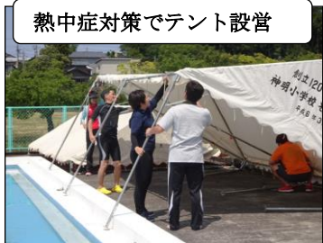
熱中症対策でテント設営