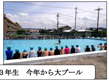
3年生 今年から大プール