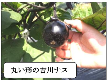
丸い形の吉川ナス

子どもたちが育てているアサガオやホウセンカ、野菜などがすくすくと育っています。1年生は大きくなったアサガオに支柱を立てました。また、学校給食畑のサツマイモや吉川ナスも順調に育っています。