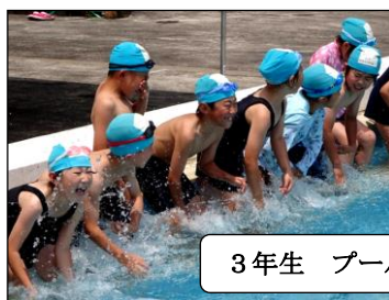
3年生 プールサイドでバタ足