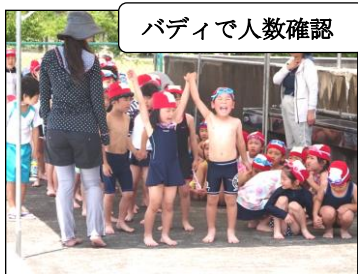
バディで人数確認