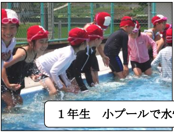
1年生 小プールで水慣れ