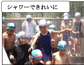
シャワーできれいに