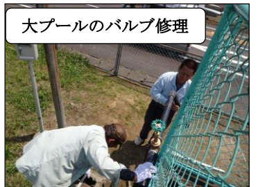
大プールのバルブ修理

修繕も完了し、テントの設営も終わり、天候にも恵まれた18日(火)に今年最初の水泳学習が行われました。水泳学習時の注意事項を再確認し、少しずつ水に慣れながらプールに入りました。