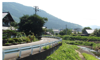
▲弁財天山周辺道路