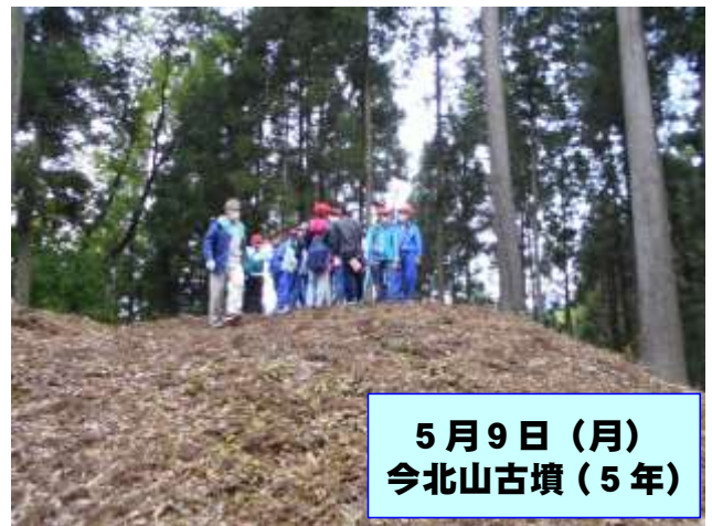
5月9日(月) 今北山古墳(5年)