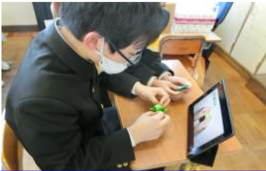
折り紙（手芸・バスケットボール）

今年度もクラブ活動が始まりました。自分で選んだ活動ということもあり、どの子どももわくわくしながら楽しく活動ができました。感染症防止対策を講じながら、子どもたちが興味をもってできる活動を取り入れていきたいと考えています。保護者の皆様や地域の皆様のご支援やご協力をお願いいたします。