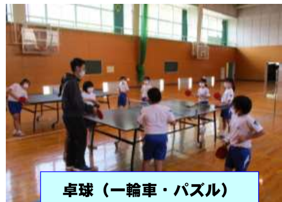
卓球（一輪車・パズル）