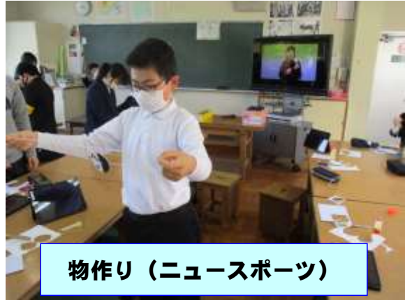
物作り（ニュースポーツ）