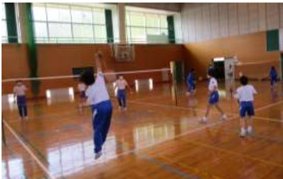
バドミントン（プログラミング）