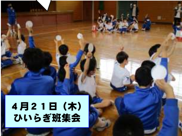
4月21日(木) ひいらぎ班集会