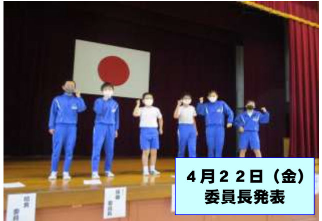
4月22日(金) 委員長発表